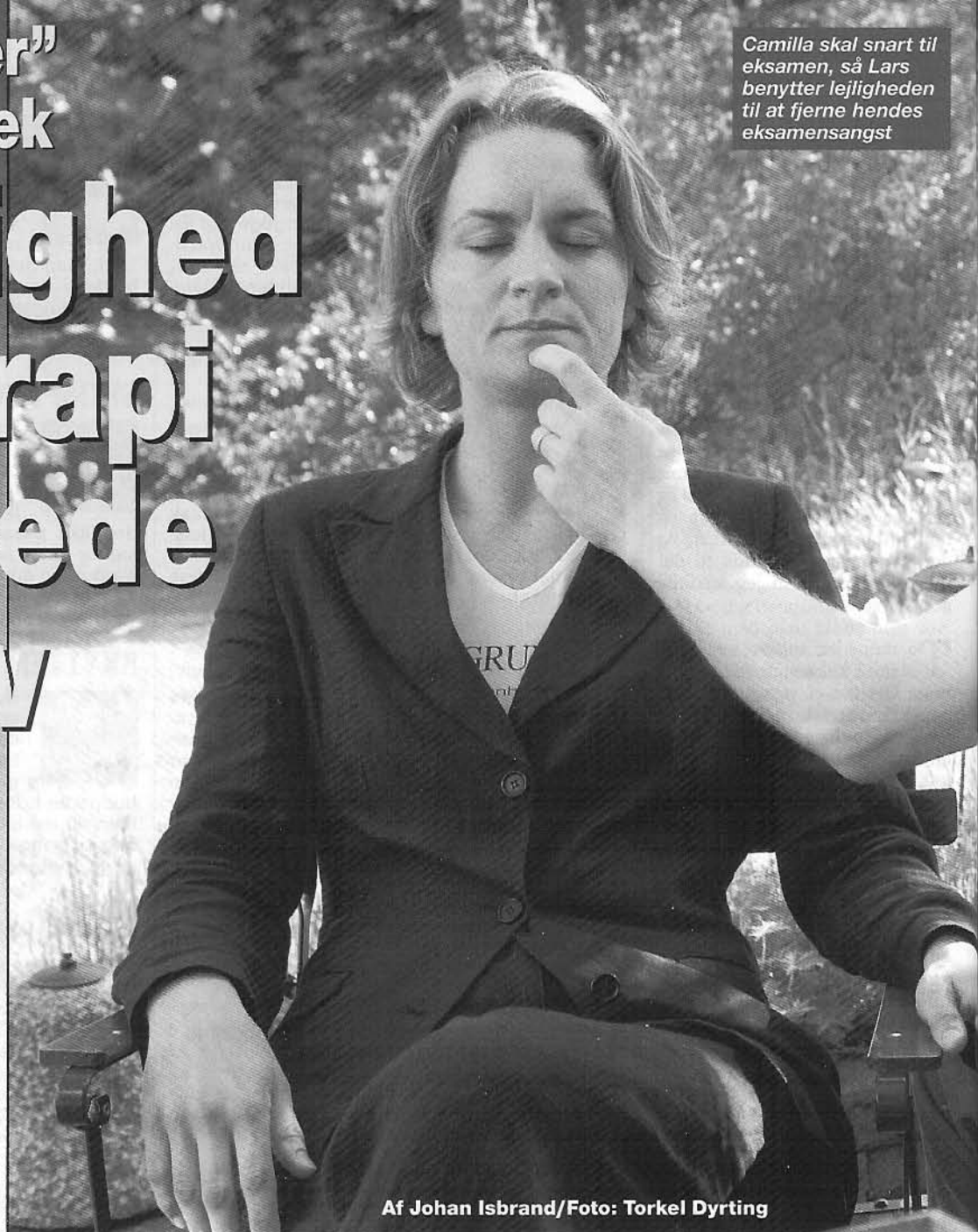
Af Johan Isbrand

Camilla skal snart til eksamen, så Lars benytter lejligheden til at fjerne hendes eksamensangst